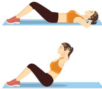
Hình 2: Hình ảnh minh họa nội dung thi số 2